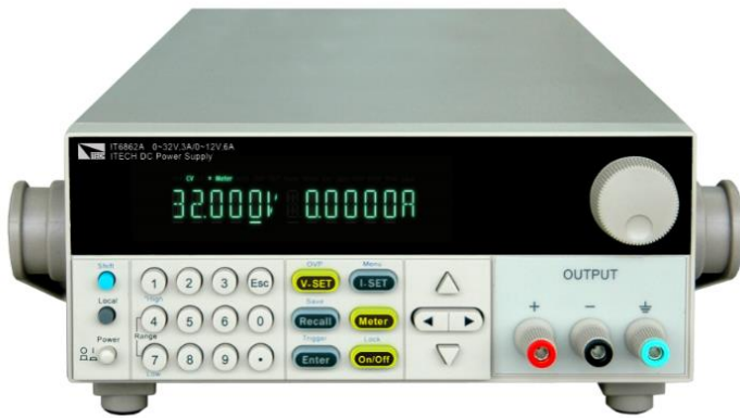
图二 IT6800A 电源

IT6300,IT6800A/B,IT6400 系列线性直流可编程电源具有高分辨率,高精度,低纹波等特性,可完美满足手机背光的测试需求。