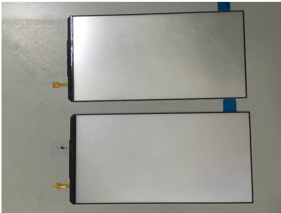
图一 手机背光图片

手机背光源集成在液晶屏下，用以照亮手机屏幕。主流手机屏幕材质主要分为 TFT,LED,LCD，其中 TFT 和 LCD 都需要手机背光源，且背光源的功耗、使用寿命、发光强度、均匀度等光电参数直接决定了手机屏幕的品质及使用寿命，下图为 LCD 材质手机背光板。